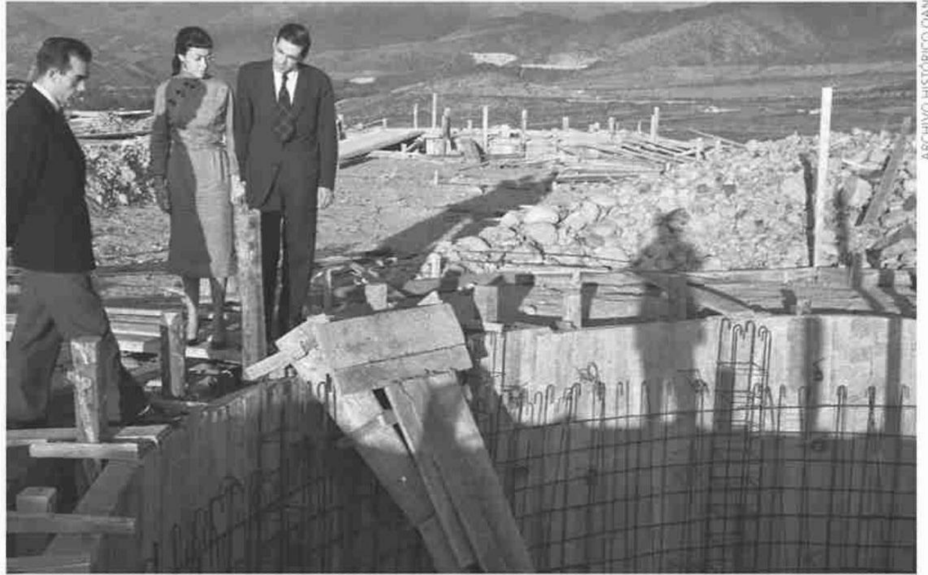
Construcción en el Cerro Calán, 1956.