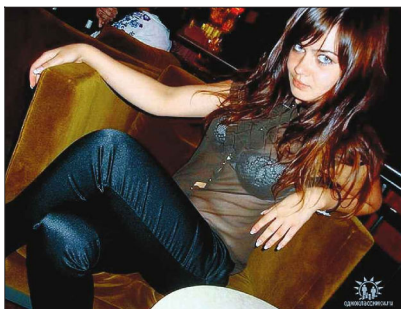
Esa carita era más peligrosa que el plutonio.

En la imagen, la recreación de cómo sería "g", el planeta perdido.