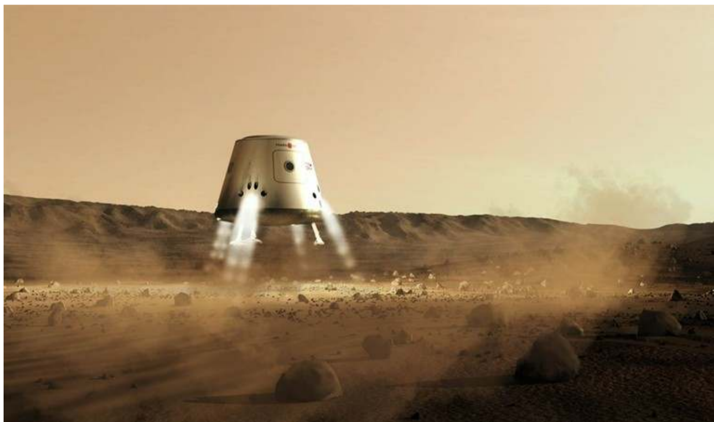
El proyecto Mars One busca llevar seres humanos a Marte.

El taller comenzará el 28 de septiembre en el Observatorio Astronómico Nacional.